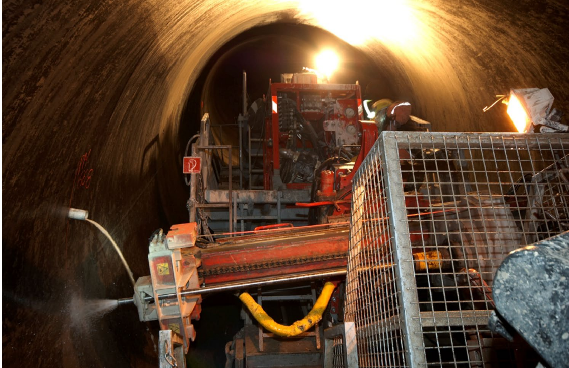
Bohrgerät im Druckstollen